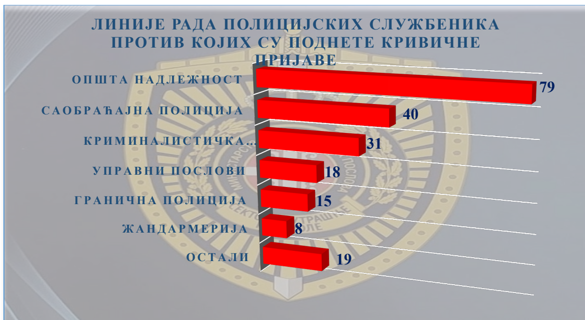
Графикон број 2

Од укупног броја полицијских службеника и других запослених у Министарству против којих су поднете кривичне пријаве - 210 , највише је полицијских службеника полиције опште надлежности , тачније њих 79 (односно око 37,6% ). Пријавама су обухваћени и полицијски службеници саобраћајне полиције , њих 40 (односно око 19,1% ), затим криминалистичке полиције - 31 (односно око 14,8% ), полицијски службеници управних послова - 18 (или око 8,3% ), полицијски службеници граничне полиције , њих 15 (односно 7,1% ), Жандармерије - 8 (или 3,7% ), док полицијски службеници и запослени у другим организационим јединицама Министарства , тачније њих 19 , чине 9,4% .