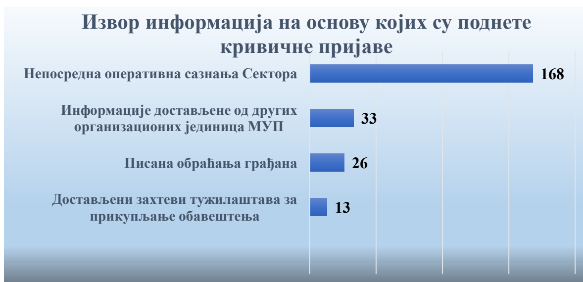
Графикон број 1

Највећи број поднетих кривичних пријава - 168 , односно око 70% , резултат је непосредних провера оперативних сазнања до којих су, на основу сопствене иницијативе, долазили полицијски службеници Сектора. Такође, 33 кривичне пријаве, односно 13,8% , резултат је заједничког рада и информација достављених од других организационих јединица Министарства. Сектор је вршио провере и поднео кривичне пријаве на основу 26 писаних обраћања грађана, а поступајући по достављеним захтевима тужилаштва поднето је 13 кривичних пријава.