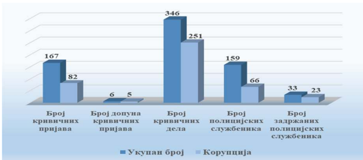
Графикон број 3

Полицијски службеници и други запослени у Министарству, против којих су поднете кривичне пријаве, најчешће су вршили кривична дела са елементима корупције која представљају 72,5% у односу на укупан број кривичних дела која су извршили. Од укупног броја полицијских службеника и других запослених против којих су поднете кривичне пријаве према 21,7% је одређена мера задржавања.