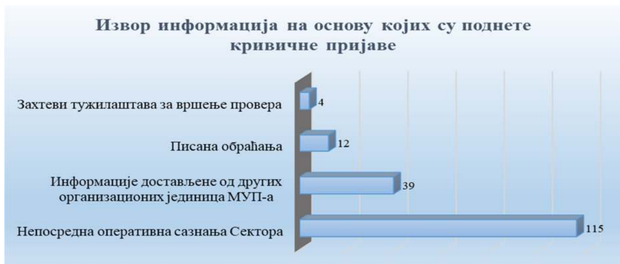
Графикон број 2

Највећи број кривичних пријава (око 67,6%) поднет је након непосредних провера оперативних сазнања до којих су, приликом поступања по службеној дужности, долазили полицијски службеници Сектора. У циљу размене оперативних података и спровођења свеобухватног поступка провера, остварена је сарадња са другим организационим јединицама Министарства, што је у одређеним случајевима резултирало заједничким радом и подношењем пет кривичних пријава (са ОБПК-УКП; ПУ у Новом Саду; ПУ за град Београд; ПУ у Новом Пазару и ПУ у Крушевцу).